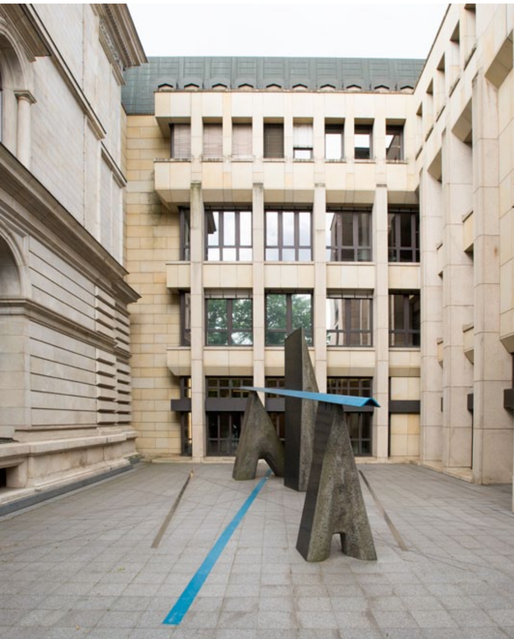
Innenhof, Louis Niebuhr, Triade, 1996/97, Stein und Stahl