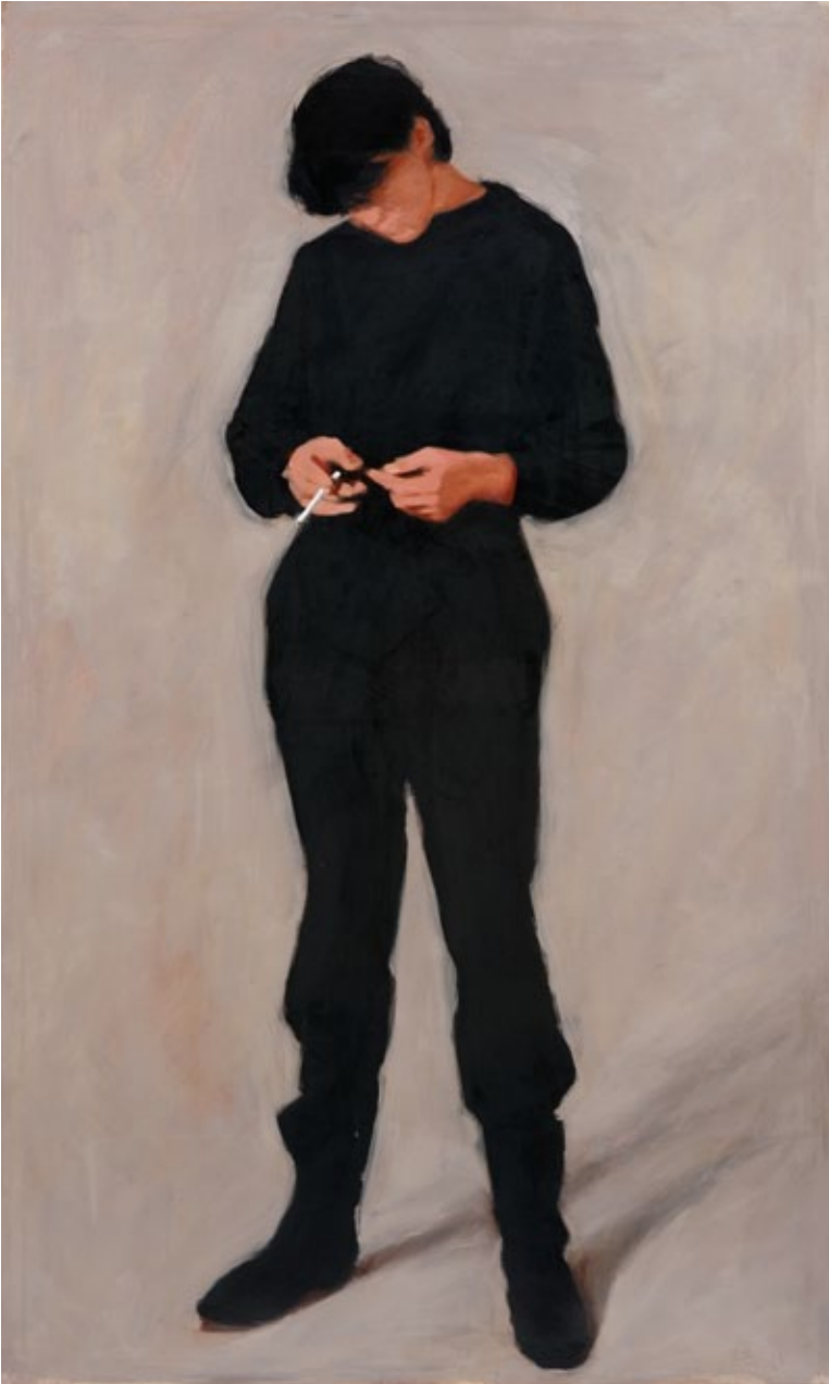
Anke Doberauer, Ohne Titel, 1986, Öl auf Leinwand