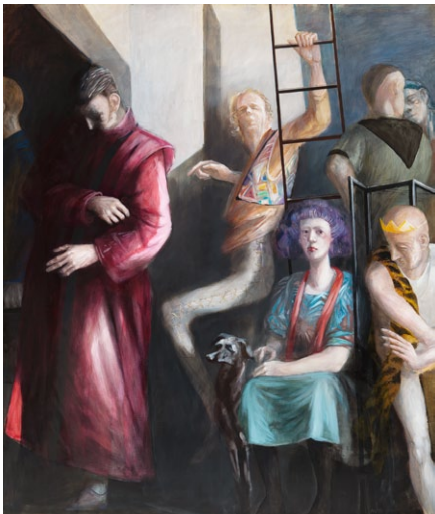
Andreas Wachter, Ohne Titel , 1993, Öl und Tempera auf Leinwand