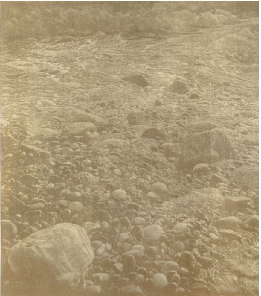
Franz Gertsch, Cima del Mar, 1990, Holzschnitt