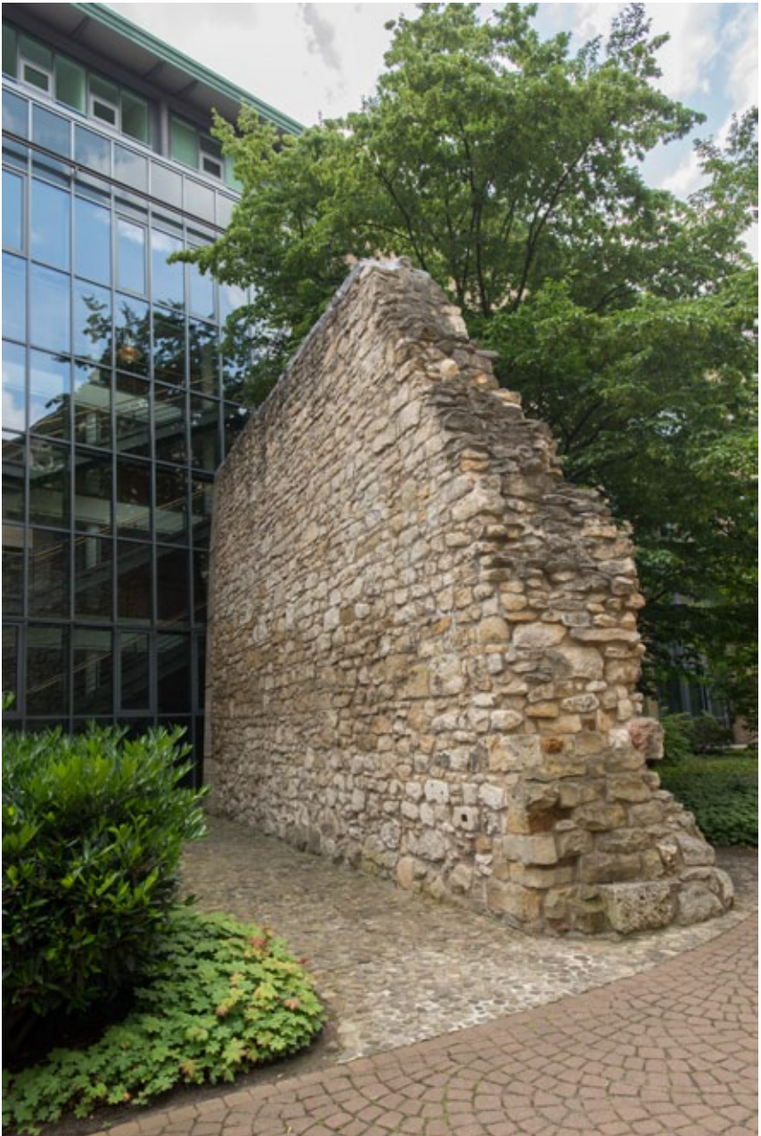
Blick auf die Außenfassade des Neubaus mit der historischen Stadtmauer