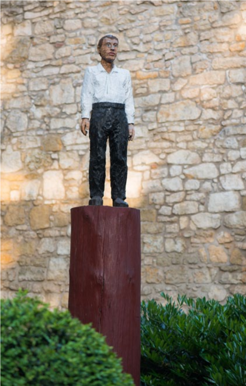
Stephan Balkenhol, Große Säulenfigur , 2001, Holz