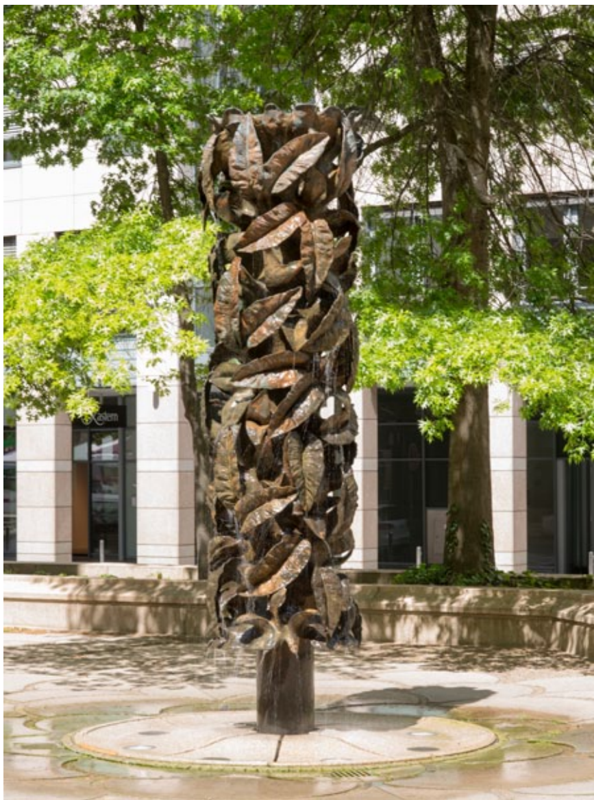
Emil Cimiotti, Vegetative Säule, 1986, Bronze