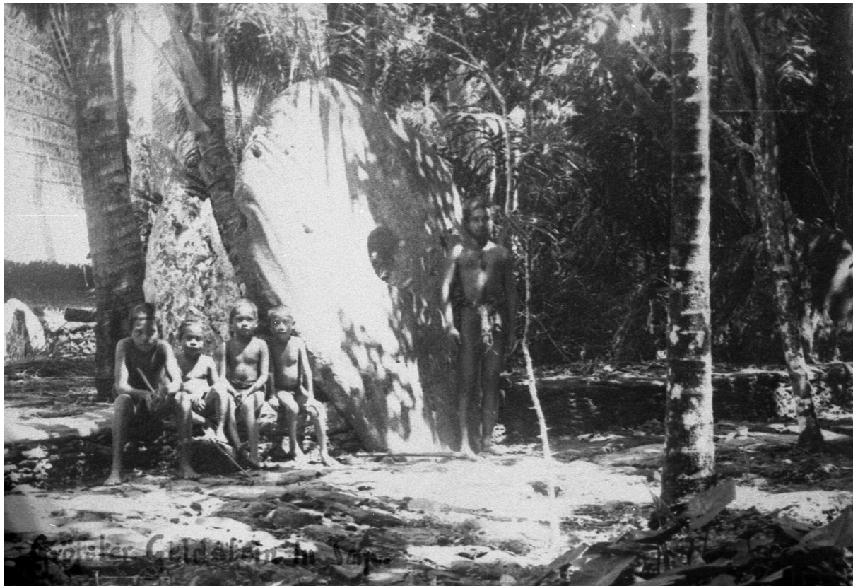
Abb. 9 „Größter Geldstein in Jap“. Der Durchmesser beträgt etwa 3 Meter. Foto aus der Zeit um 1908/1911.