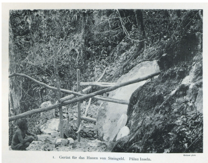
1. Gerüst für das Hauen von Steingeld. Palau Inseln.