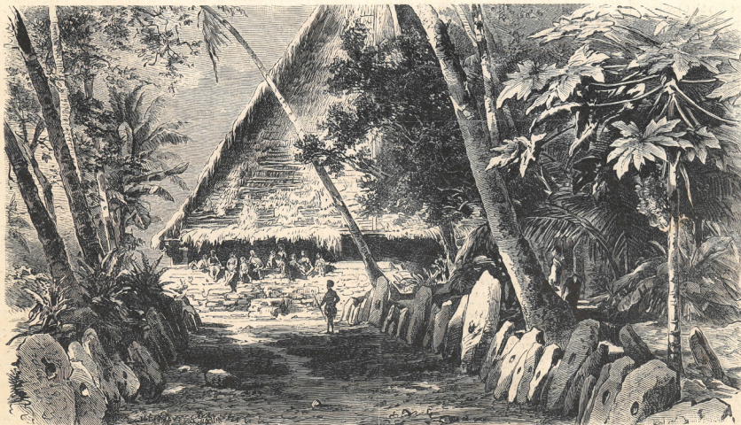
Versammlungshaus und Geldsteine auf der Insel Yap.