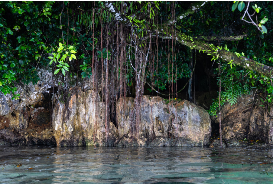
Abb. 7 Zwei große Halbfabrikate von Steingeld ragen direkt am Strand der Felseninsel Orrak ins Wasser. Im Hintergrund links davon ist eine Höhle zu erahnen. Die Halbfabrikate messen ca. 1 x 1 m (links) und 90 cm x 2 m (rechts).