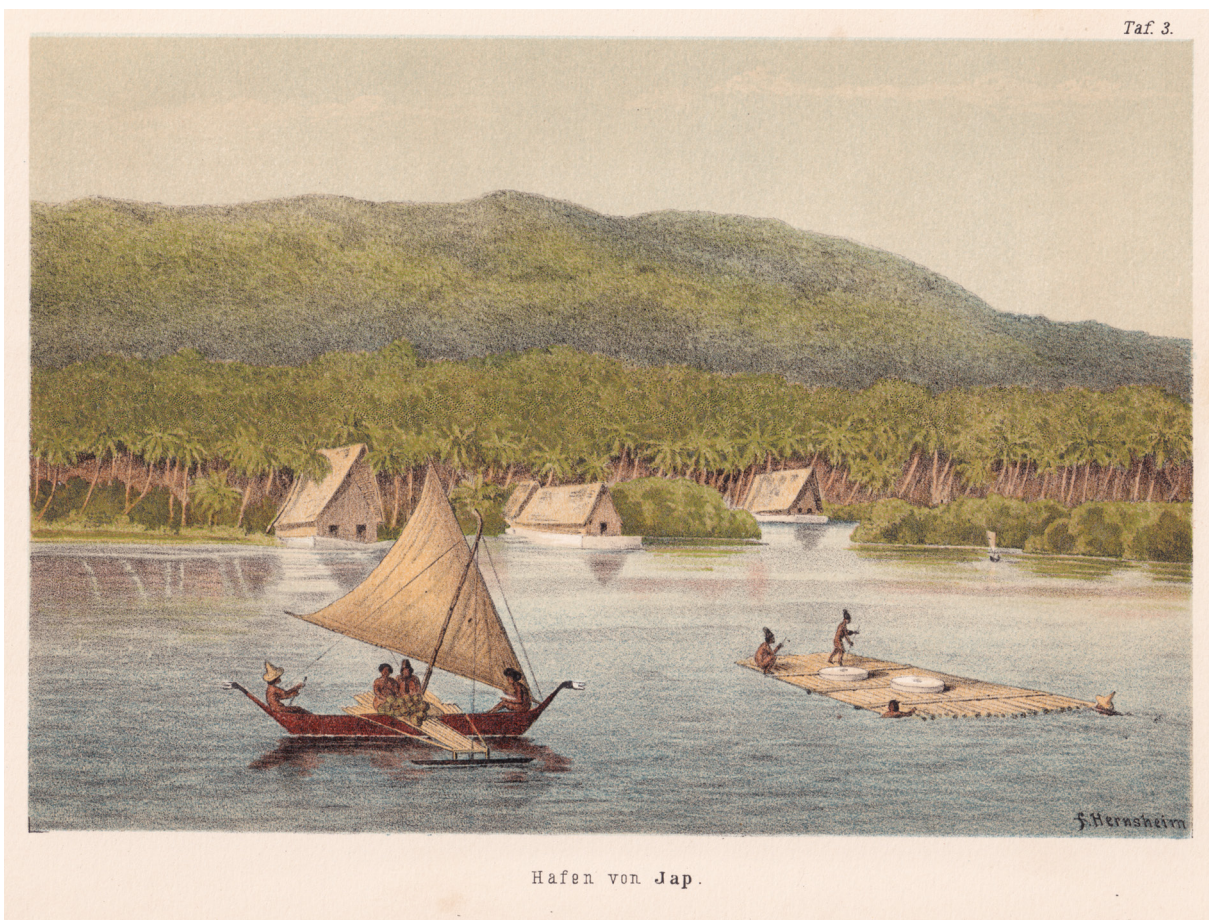
Abb. 12 Anlandung von Steingeld im Hafen von Yap.

aus Yap wahrgenommen, die für den Abbau der Steine zudem Gegenleistungen zu erbringen hatten. „Die breite gepflasterte Straße auf der Insel Koror in den Palau ist [...] nicht von den Bewohnern Korors, sondern von Yapern als Gegenleistung für die Genehmigung zum Steinbrechen für die Geldfabrikation gebaut worden.“ 39 Ganz allgemein „legen die Palauer den Japern keinerlei Schwierigkeiten bei deren Liebhaberei, Steingeld zu brechen, in den Weg. Diese zeigen sich dadurch erkenntlich, daß sie den zuständigen Palauern Geschenke mitbringen oder für sie öffentlich nützliche Arbeiten ausführen (der gepflasterte Weg in Koror, der Steinwall bei Eirei).“ 40 Die Umstände des Abbaus beschrieb Eduard Hensheim. Er berichtet, dass er am 22. September 1874 die Palaugruppe erreicht habe. „Auf Malakal befanden sich zu dieser Zeit noch etwa sechzig Eingeborene von Jap. Vor anderthalb Jahren waren sie von dem Prinzipal Cromartys auf die Gruppe gebracht worden, um hier das in Jap gebräuchliche Steingeld zu verfertigen. Auf den Palau-Inseln existieren ganze Berge von Gips und Kalkspat, und dieser Stein, wohl behauen und gerundet, gilt auf Jap seit alten Zeiten als Zahlungsmittel. Der Wert des Stückes steigt in geometrischer Progression mit der Größe. In früheren Jahren kamen die Jap-Eingeborenen in ihren Kanus nach den Palau-Inseln und nahmen ihre Steine in denselben zurück. Dies war eine gefährliche Sache, denn öfters