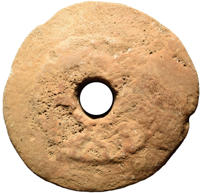
Abb. 2 Yap, Steingeld aus Palau, früherer Typus. Durchmesser 77 cm, 69 kg. Numismatische Sammlung der Deutschen Bundesbank, Inv.-Nr. 0255/82.

Unreflektiert übernehmen darf man die Aussagen des späten 19. und frühen 20. Jahrhunderts zu den deutschen Kolonien natürlich nicht. Erstens unterschied sich das Menschenbild in der damaligen Zeit markant von unserem heutigen. Es schwankte in Bezug auf die Südsee zwischen ‚edlen Wilden‘, die in einer paradiesischen Idylle lebten, und ‚Kannibalen‘, die als ‚Barbaren‘ in der schwülen Hitze des tropischen Regenwalds