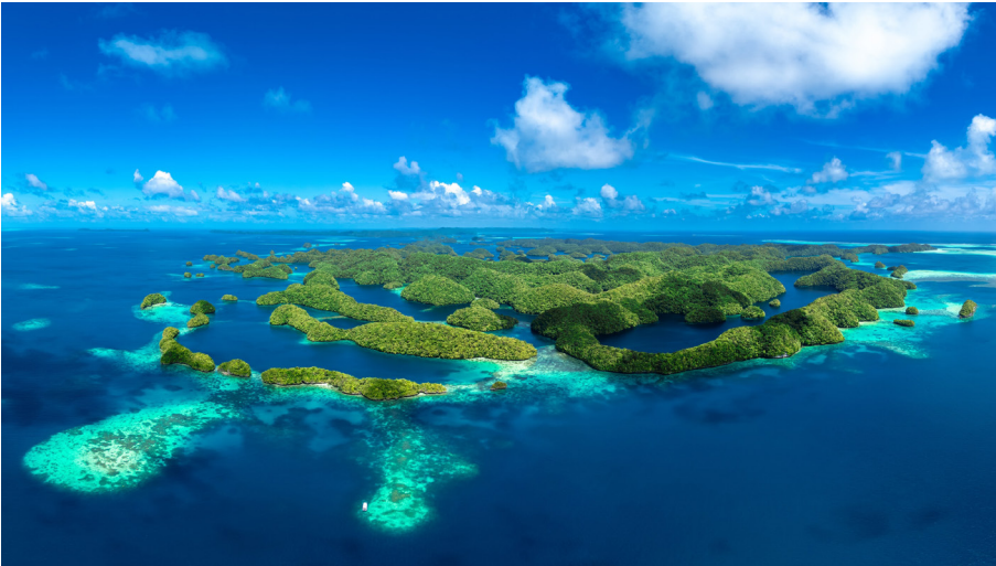
Abb. 6 Die Inselwelt Palaus.