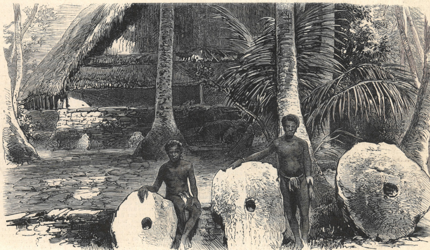
Häuptlinge und Geldsteine auf der Insel Yap.

Die Bewohner, kräftige Gestalten von bräunlicher Hautfarbe und in ihrer friedfertigen Gesinnung grundverschieden von den negerartigen wilden Stammesleuten Neuhollands, dehnen ihre Reisen auf kleinen Canoes bis zu den Marianen- und Palau-Inseln aus. Nicht im Besitze von Meßinstrumenten, mit deren Hilfe der Seefahrer sein weit entlegenes Ziel sicher findet, helfen sie sich damit, daß bei günstigem Winde eine Anzahl Canoes in möglichst ausgebreiteter Linie nebeneinander fahren. Denn nur so ist Aussicht vorhanden, daß man endlich das betreffende Land findet. Oft genug kehrt freilich eine derartige Expedition nicht wieder heim, weil sie trotz der angewandten Vorsicht das Ziel verfehlt oder von einem Sturm, dem die gebrechlichen Fahrzeuge nicht Stand halten können, übertraht wurde.