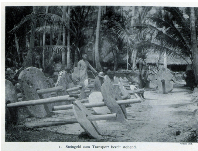
1. Steingeld zum Transport bereit stehend.