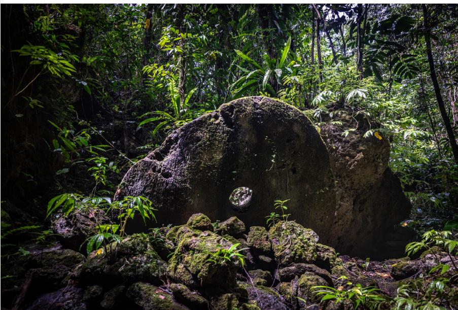
Abb. 8 Fast vollendeter Geldstein mit einer Höhe von etwa 2 m und rund 30 cm Dicke.