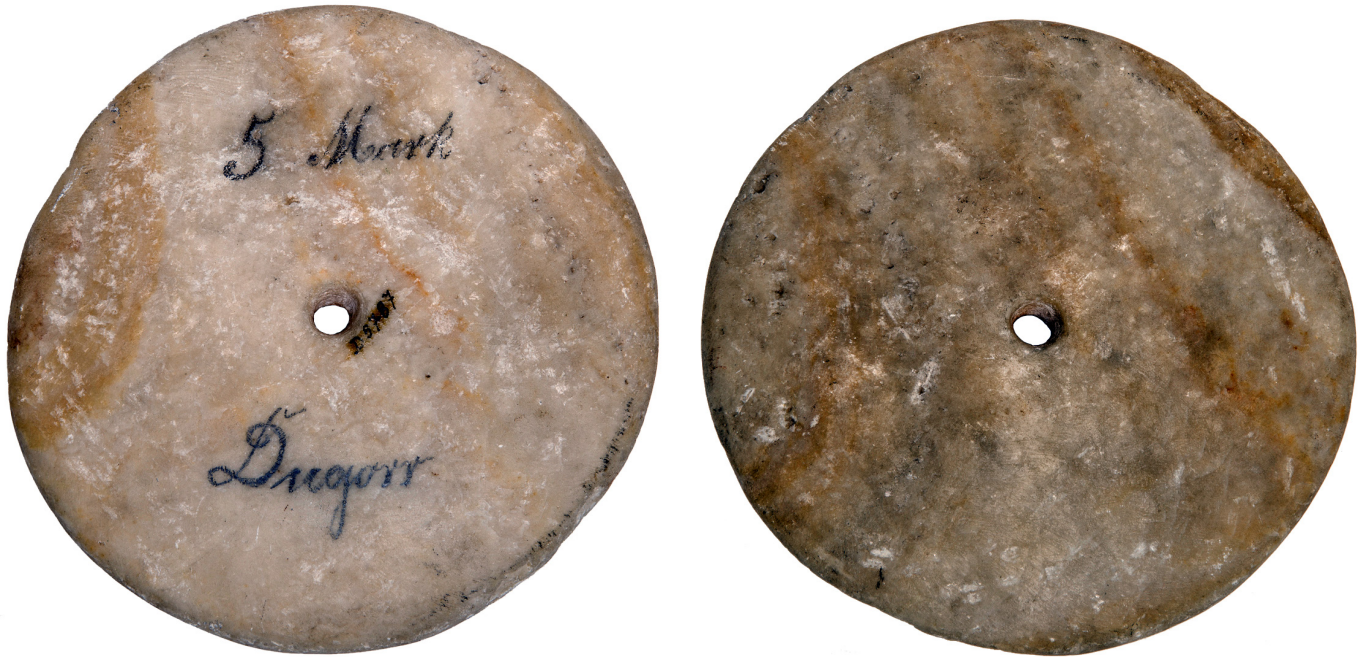
Abb. 14 Geldstein mit handschriftlicher Angabe „5 Mark / Dugorr“. Übersee-Museum Bremen, Inv.-Nr. D05787.

available as a circulating medium in the Fatherland. At last, by a happy thought, the fine was exacted by sending a man to every failu and pabai throughout the disobedient districts, where he simply marked a certain number of the most valuable fei with a cross in black paint to show that the stones were claimed by the government. This instantly worked like a charm; the people, thus dolefully impoverished, turned to and repaired the highways to such good effect from one end of the island to the other, that they are now like parkdrives. Then the government dispatched its agents and erased the crosses. Presto! the fine was paid, the happy failus resumed possession of their capital stock, and rolled in wealth." 61