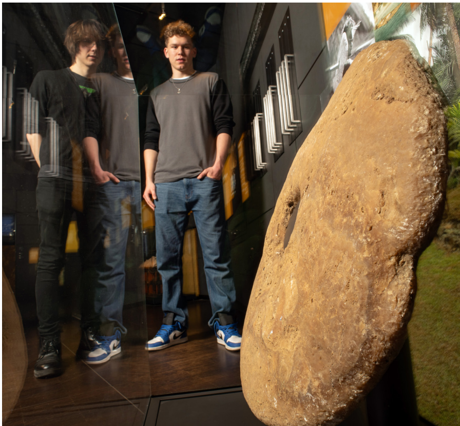
Abb. 1 Steingeld in der Ausstellung des Geldmuseums der Deutschen Bundesbank in Frankfurt am Main.

Diese außergewöhnliche Geldform gehört nicht dem europäischen Kulturkreis an, sondern sie ist in der Südsee beheimatet, wo derartige Zahlungsmittel auf dem nördlich von Neuguinea gelegenen Yap Verwendung fanden und noch heute zu bestaunen sind.