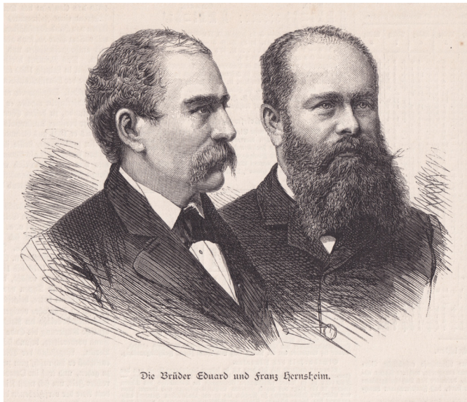
Abb. 5 „Die Brüder Hensheim“, in: Illustrierte Zeitung Nr. 2176 vom 14. März 1885, S. 266.

Hensheim (1847–1917), von 1883 bis 1887 Kaiserlicher Konsul für den Westpazifik auf Matupi im Nordosten des Bismarck-Archipels ( Abb. 5 ), schenkte dem Völkerkundemuseum Steingeld 22 , wie dessen amtliche Berichte über Zugänge des letzten Quartals 1896 vermerken: „Ein großes und ausgezeichnet schönes Stück Arragonitgeld von Yap ist uns als Geschenk von Herrn Konsul Hensheim zugegangen.“ 23