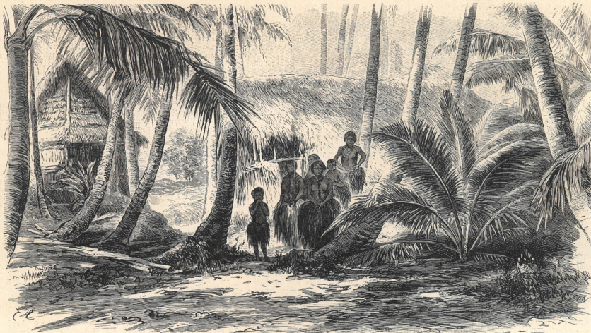
Hütte der Eingeborenen auf der Insel Yap.

Behauptungen nicht berauschend. Nicht bezeichnend für die menschenfreundlichen Gesinnungen gewisser Leute ist der Umstand, daß die Missionare auf vielen Inseln dieses zwar unappetitliche, aber doch unschädliche Nationalgetränk verboten haben. Man führte dafür Schnaps ein.